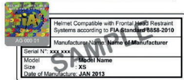
FIA-Label gemäß FIA-Standard 8858-2010

Die nachträgliche Label-Kennzeichnung von, vom Hersteller bzw. dessen autorisierten Händler, umgerüsteten Helmen erfolgt grundsätzlich durch den Helm-Hersteller bzw. dessen autorisierten Händler, nach Überprüfung der ordnungsgemäßen Nachrüstung.